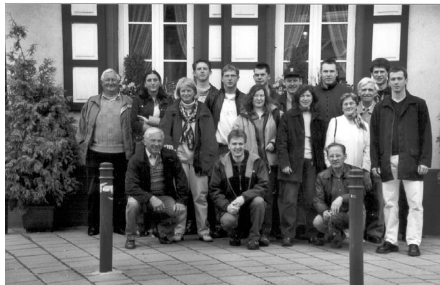
Alle Teilnehmer des Ausflugs, vor unserem Hotel.